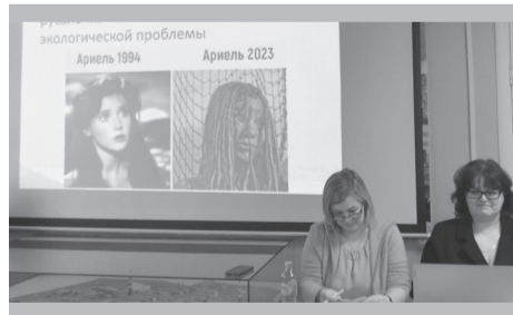
И всего минута на размышление

Во второй, кнопочной игре – «Соликамский квизбол» – нервы у игроков натянуты были – звенели! Нужно было по пересказу в прозе узнать известное стихотворение. Объявление задания, правда, дикого восторга не вызвало – но угадывали знатоки стихи буквально по двум первым предложениям! Ни одну заготовку до середины даже не дочитывала! Тайные ценители поэзии