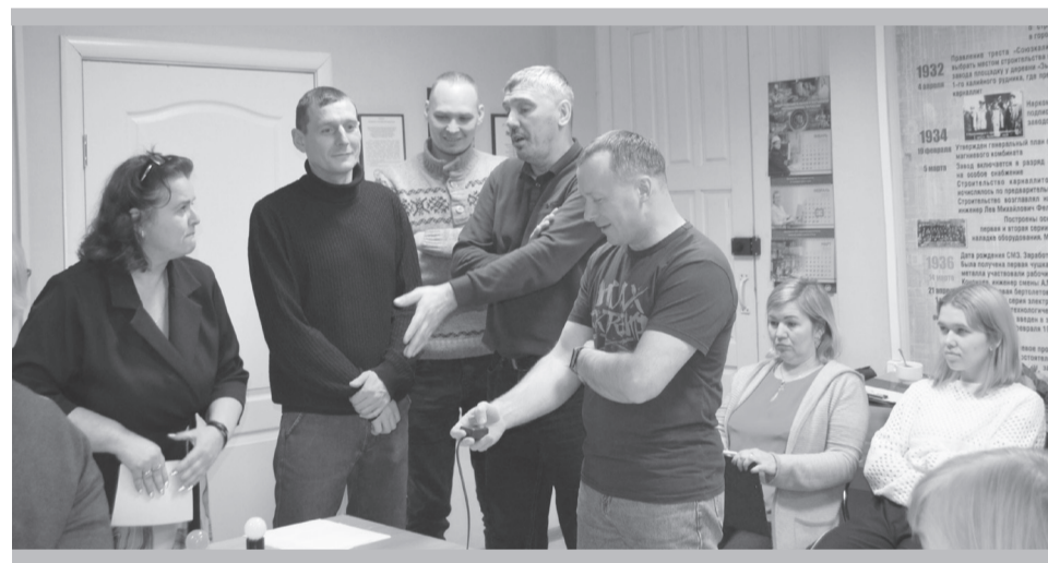
«Коварный» кнопочный квизбол

И в самое сердце поразили знатоки РМЦ «Монолит», которые решили сложную ситуацию с проблемами принца Уильяма. Молодцы! А лидеры – не смогли!