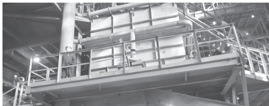
Хлоратор лопаритовый, основной агрегат цеха № 7