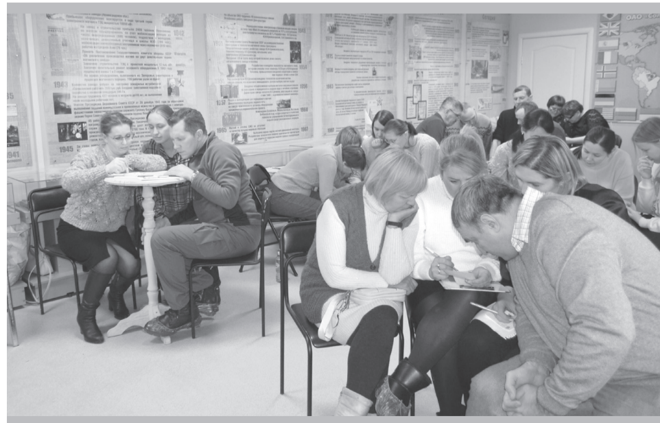
Ну, просто «слышен» «скрип» мозгов!